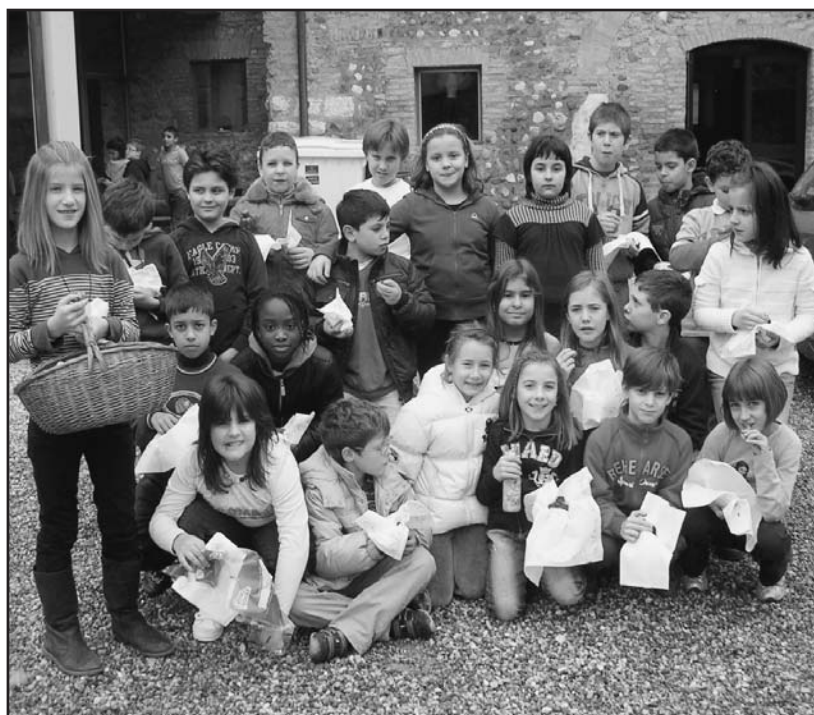
Un gruppo di alunni col cesto delle caldarroste e i cartocchetti ormai tristemente vuoti.